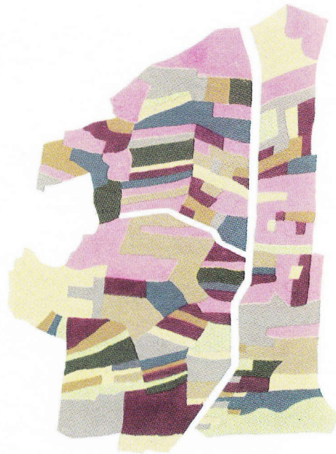
boven : het verkavelde land zoals het vroeger was

gericht, begon ook met het vastleggen van de huurprijzen. Nadien werden de bevoegdheden uitgebreid, zodanig dat het eigendomsrecht werd geregeld, de verkoop van gronden bepaald en de verhouding tussen landlords en huurders gesaneerd. Thans is het zo ver, dat de commissie zich bezighoudt met de vergroting, de consolidatie en de hervorming van de kleine, niet-economische hoeven. Al lijkt deze tussenkomst sterk op nationalisering en collectivisering, toch blijft de democratische inslag bestaan: de commissie moet het akkoord van de verschillende partijen verkrijgen. Zoals we reeds vertelden, zijn de meeste kleine hoeven geconcentreerd in het armste deel van Ierland, langs de westkust. De grote oppervlakten van goede gronden liggen in het oosten van het land. Het probleem stelde zich dus als volgt: men moest trachten de uitwijkelingen uit de armste districten naar de goede gronden in het